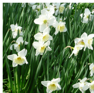
Narcissus 'Ice Follies'