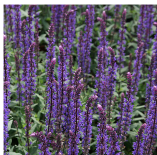
Salvia nemorosa 'Caradonna'