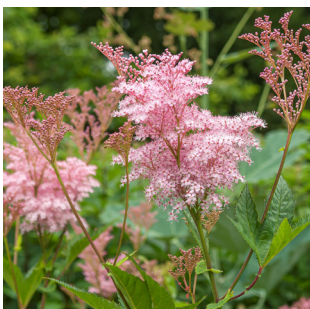
Filipendula rubra 'Venusta'