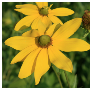
Rudbeckia nitida 'Herbstsonne'