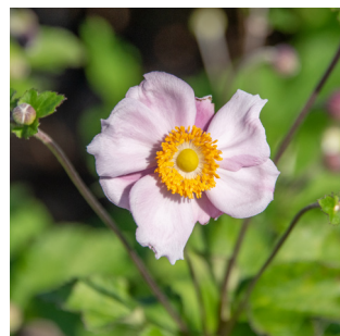
Anemone hupehensis 'September Charm'