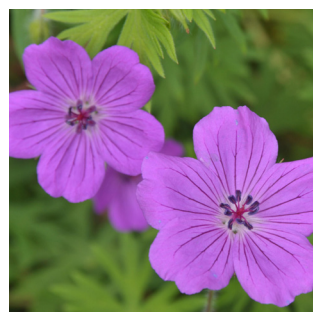
Geranium 'Tiny Monster'